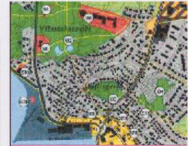
ADALSKIPULAGS HAFNARFJARÐAR 1995-2015