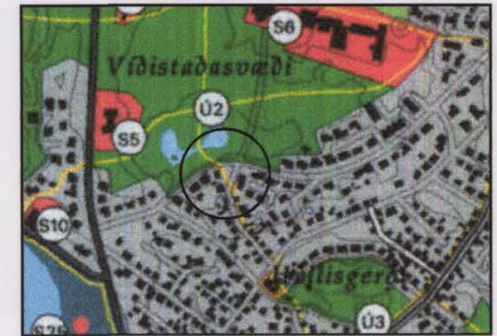
Staðsetning í bæjarlandi

Forsaga tillögunnar er fyrst og fremst sú, að bílastæði fylgi húsi að Garðavegi nr.15. Í dag fylgja húsinu engin bílastæði.