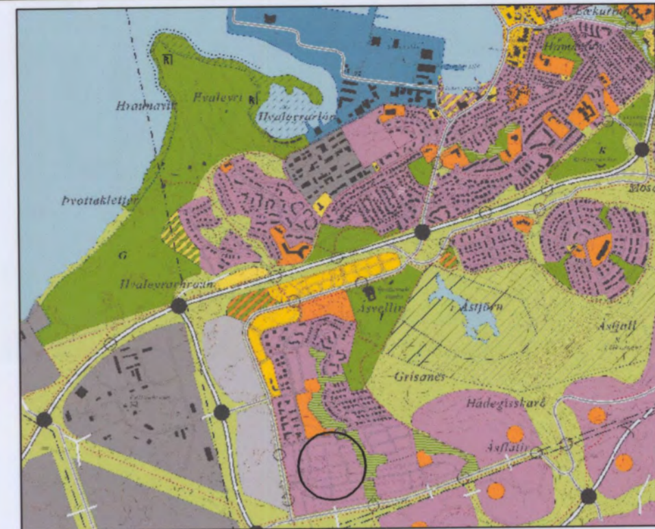
Aðalskipulag Hafnarfjarðar 2005 - 2025