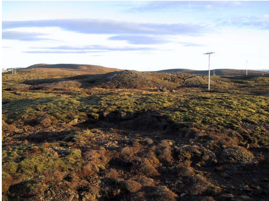
Horft að Grísanesi

Deiliskipulagið er sett fram í greinargerð þessari ásamt skipulagsupprætti og skýringarupprætti. Skipulagsuppráttur er í mælikvarða 1:1000, dags. 07.07.2005, þar sem settir eru fram helstu þættir skipulagsins.