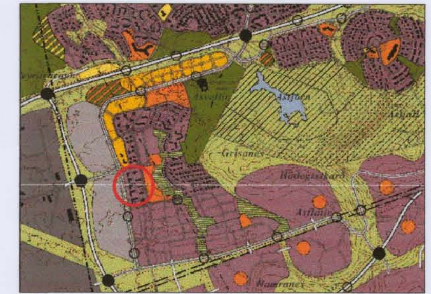
Aðalskipulag Hafnarfjarðar 2005-2025

Fjöldi bílastæða innan hvernar lóðar skal uppfylla gr. 64 í byggingarreglugerð nr. 441/1998. Að öðru leiti gilda skipulagsskilmálar fyrir deiliskipulag Valla 5. áfanga dags. 9.1 2007 útgáfa 0.3.