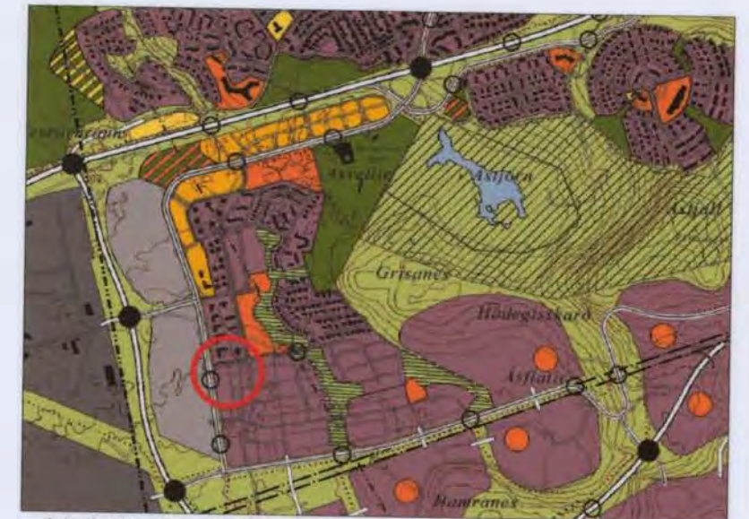
Aðalskipulag Hafnarfjarðar 2005-2025

Breytingin felur í sér lítilsháttar tilfærslu til suðurs á innkeyrslu á lóð nr. 21 við Eskivelli og staðsetning sorpkassa.