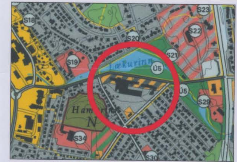
ADALSKIPULAG HAFNARFJARÐAR 1995-2015

Samþykkt í bæjarstjórn Hafnarfjarðar þann 17. des. 2002 Öðlaðist gildi með birtingu í B-deild Stjórnartíðinda þann 18. mars 2003