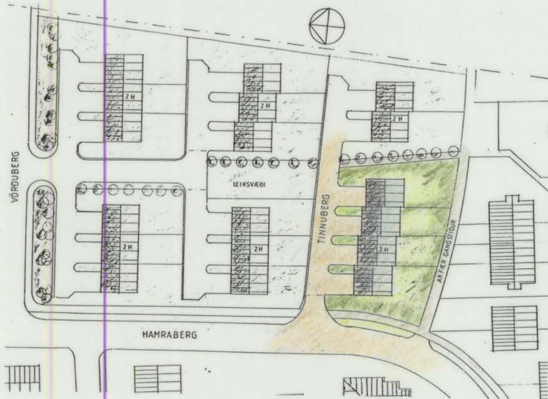
SAMÞYKKT DEILISKIPULAG 13.07.1994

Ennfremur óskar bæjarstjórn eftir því við skipulagstjóra ríkisins að hann samþykki uppdrátt þennan með undirskrift sinni að lokinni málsmeðferð í samræmi við grein 4.4.í skipulagsreglugerð nr. 318/1985.”