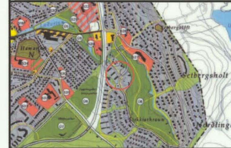
YFIRLITSMYND, ÚR AÐALSKIPULAGI