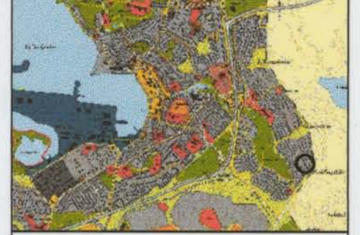
Aðalskipulag Hafnarfjarðar 1995-2015

Að öðru leyti gildir á reitnum deiliskipulag, skilmálar og uppdráttur sem samþykkt var af skipulagsstjóra ríkisins 10. jan. 1990.