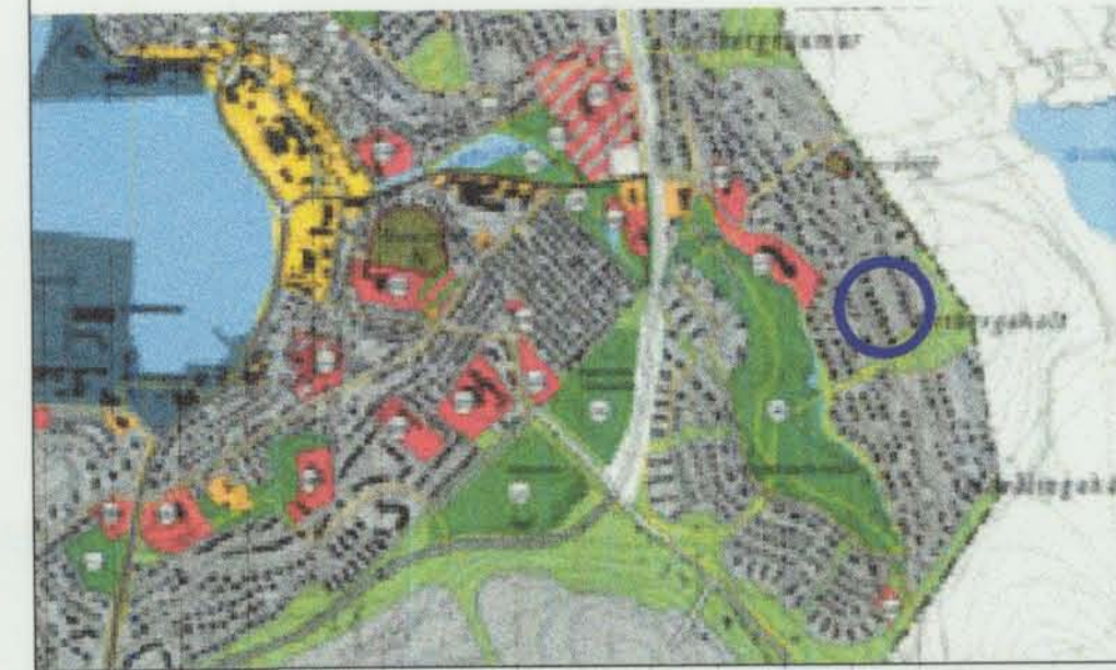
HLUTI AÐALSKIPULAGS HAFNARFJARÐAR 1995-2015

Breyting frá gildandi skilmálum felst í því að stækka húsin til austurs og byggja við húsið á einni hæð. Hæð nýbyggingar verður 2,7 m við göngustíg og 3,9 m við húsið. Byggingarreiturnar stækka um 4,0 m til norðurs. Stækkar grunnflötur hússins um 35,0 m² við það. Stærð íbúðarhúss verður um 254,6 m². Nýtingarhlutfall lóðar Klettbergs 42 verður um 0,52 eftir þessa breytingu og Klettbergs 44 um 0,59. Að öðru leyti gilda skilmálar dags. 11.01.1999. Bæjarstjórn Hafnarfjarðar lýsir því yfir að bætt verði sannanlegt tjón er einstaka aðilar kunni að verðar fyrir við breytinguna.