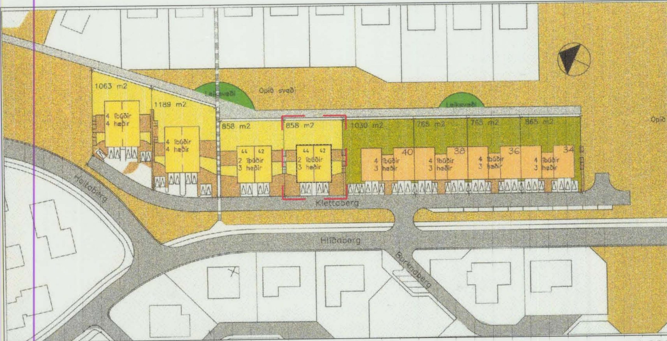
NÚVERANDI DEILISKIPULAG, ÖBLAÐIST GILDI 11.01.1999. 1:1.000