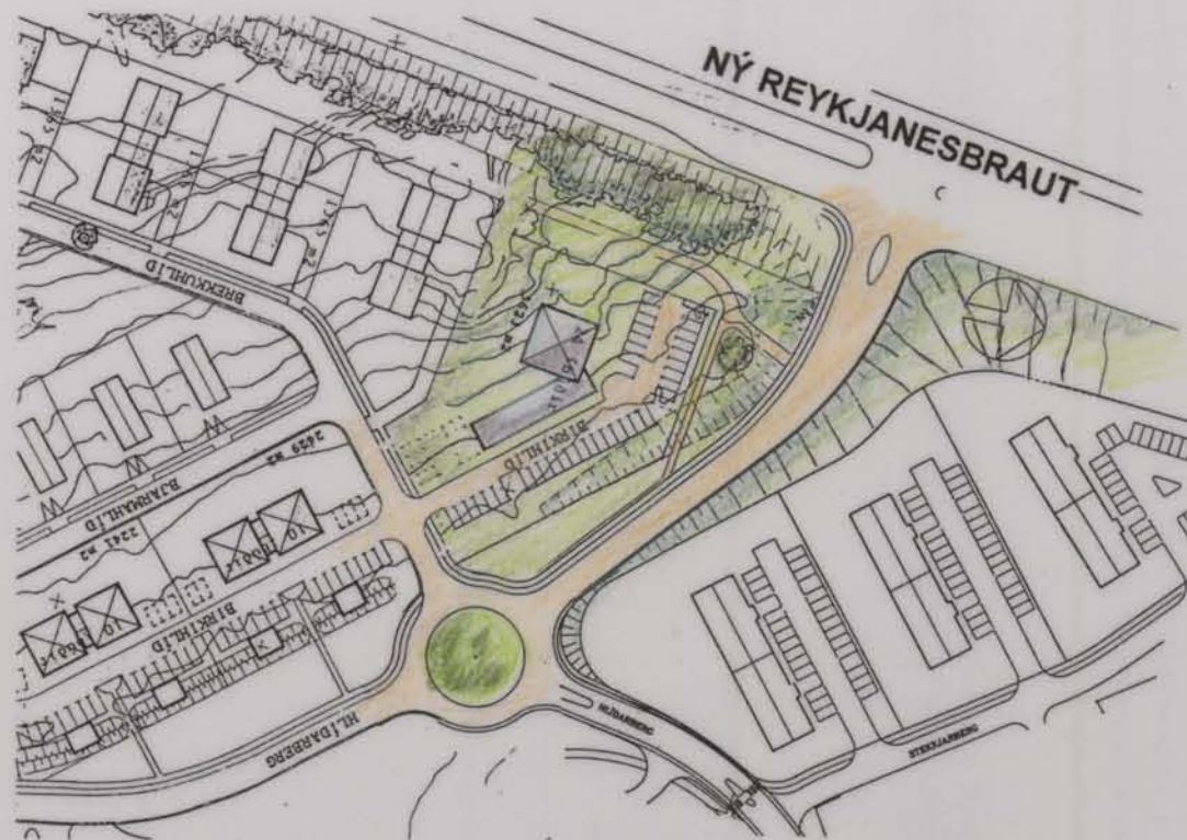
SAMÞYKKT DEILISKIPULAG 19.6.1992 BREYTT 25.3.1996

Ennfremur óskar bæjarstjórn eftir því við skipulagsstjóra ríkisins að hann samþykki uppdrátt þennan með undirskrift sinni að lokinni málsmeðferð í samræmi við grein 4.4. í skipulagsreglugerð nr. 318/1985."