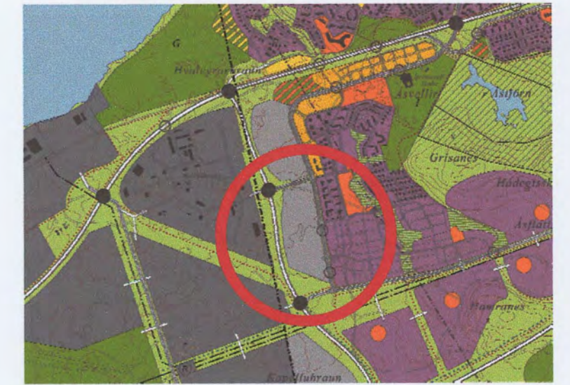
Hluti gildandi Aðalskipulags Hafnarfjarðar 2005-2025

Stærð lóðar: 3.456,0 m 2 hæðir: 2 Byggingareitur: 1.240 m 2