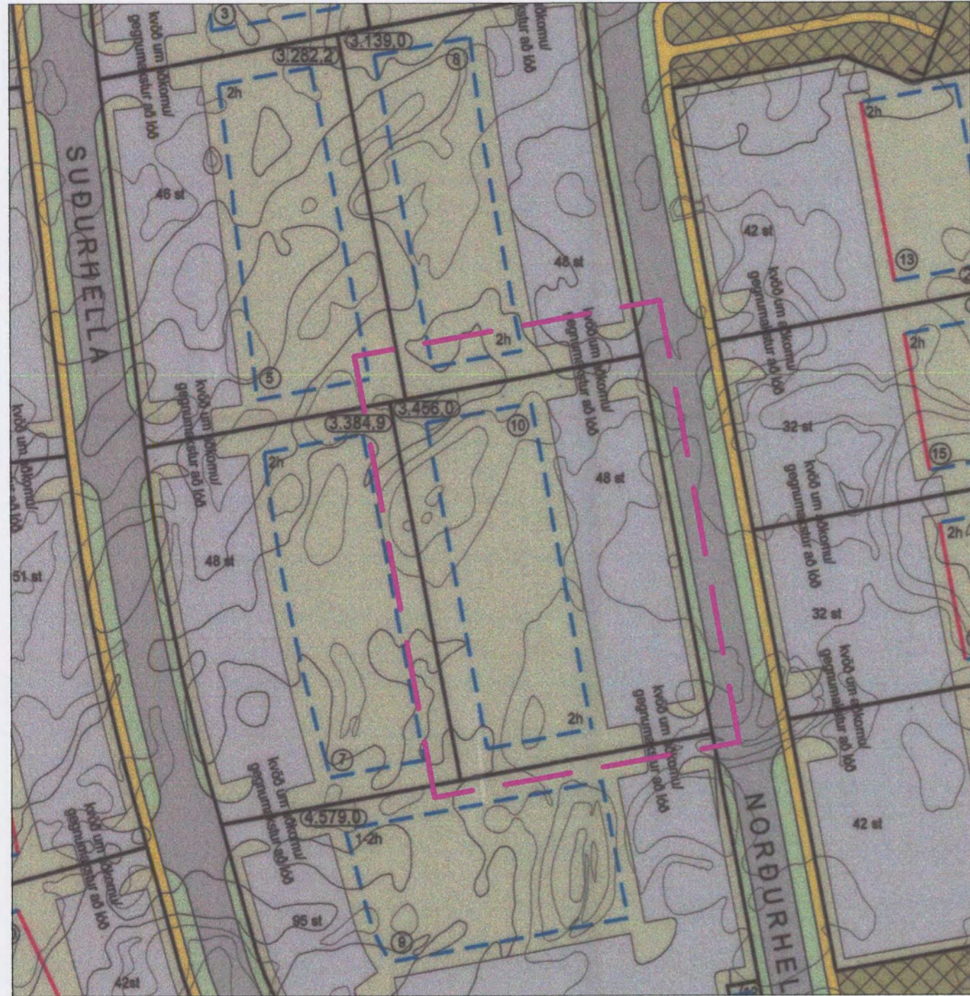
Hluti gildandi deiliskipulags, samþykkt í byggingarráði Hafnarfjarðar 26.09.2006, mkv. 1:1000