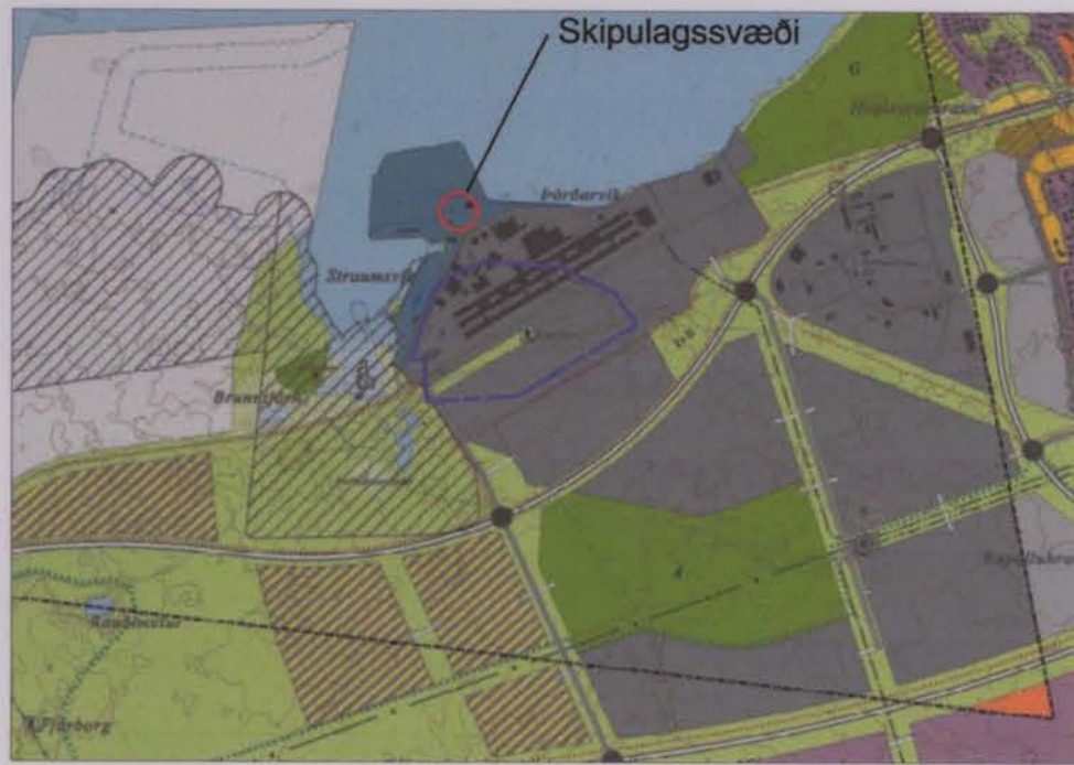
Hluti af Aðalskipulagi Hafnarfjarðar 2005-2025