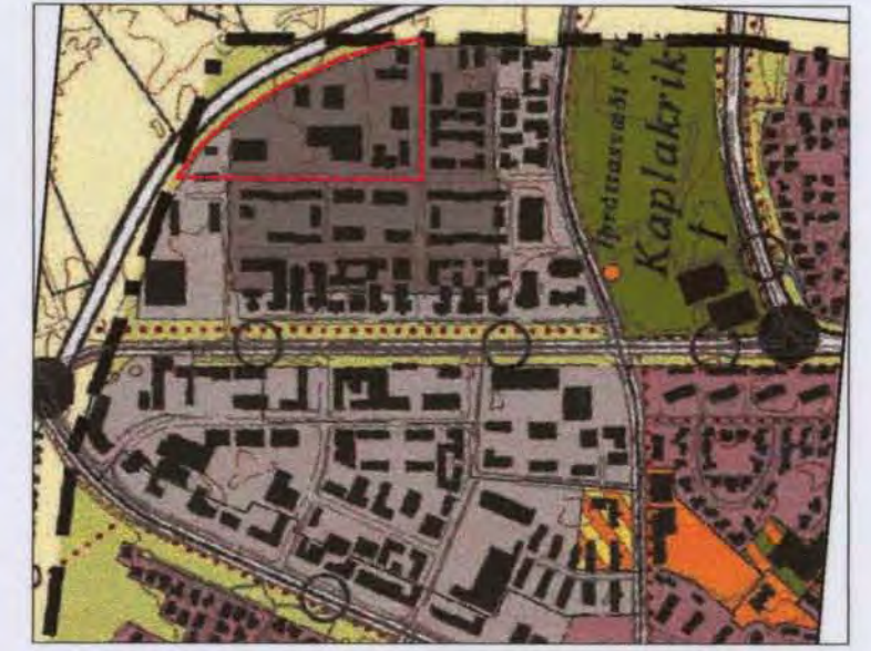
HLUTI GILDANDI AÐALSKIPULAGS HAFNARFJÖRÐAR 2005-2025