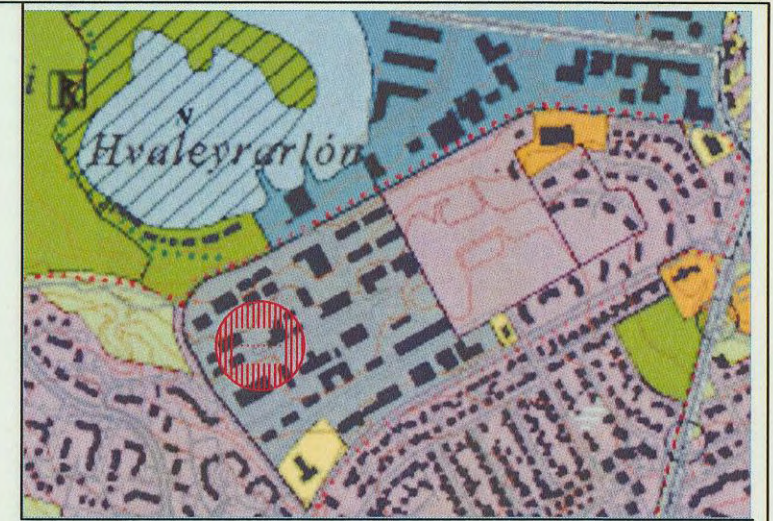
Aðalskipulag Hafnarfjarðar 2005 - 2025 Staðsetning í bæjarlandinu.

Bæjarstjórn Hafnarfjarðar lýsir yfir því, að bætt verði sannanlegt tjón er einstaka aðilar verða fyrir við breytinguna.