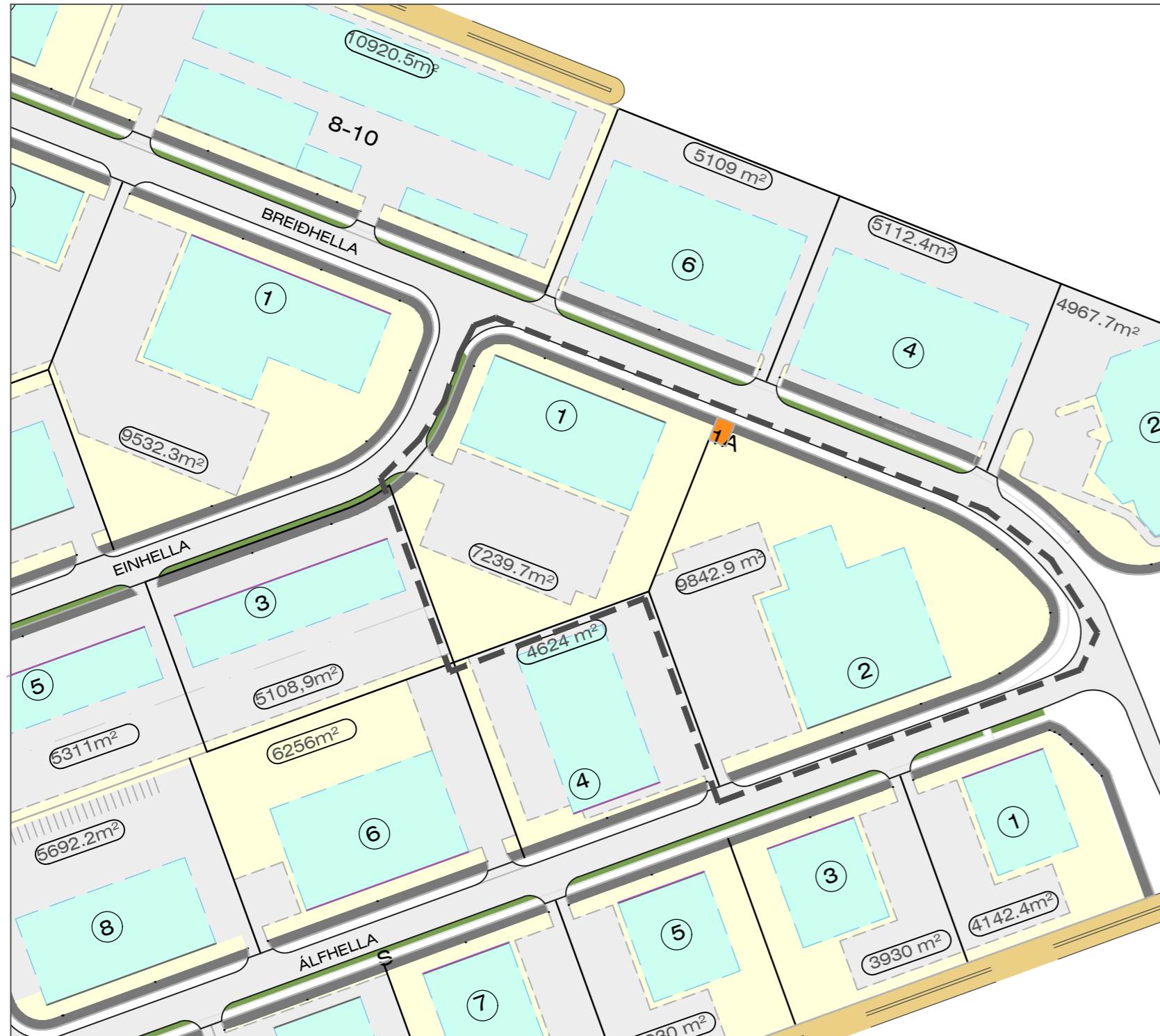
Fyrir breytingu - í gildi frá 12. júní 2007 með síðari breytingum