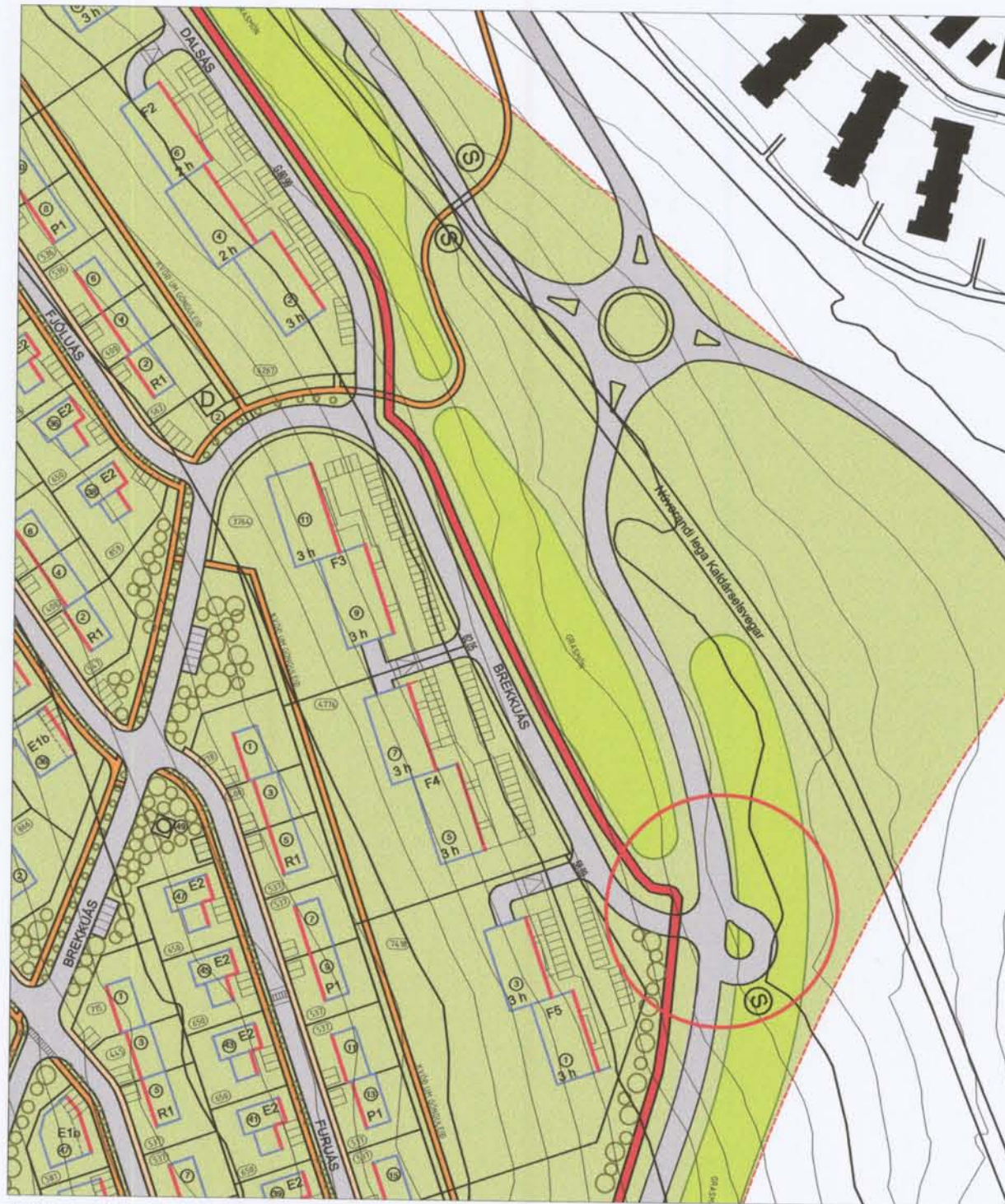
TILLAGA AÐ BREYTTU DEILISKIPULAGI — MÖRK SKIPULAGS MKV: 1:2000

Breytingin gerir ráð fyrir nýjum snúningshaus fyrir strætisvagna við Brekkuás, vegna breytinga á leiðakerfi, og sýnir jafnframt staðsetningu bíðskýlis.