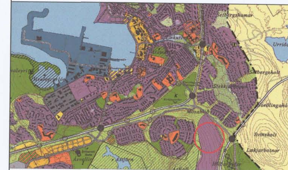
Aðalskipulag Hafnarfjarðar 2005-2025 — staðsetning í bæjarlandinu