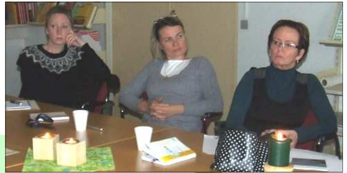
Forystuskólarnir hittust á fyrsta samráðsfundi vetrarins í vikunni.