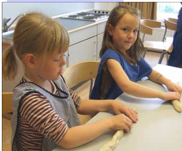
Heimilisfræðikennsla í Hvaleyarskóla fyrir í haust.

Dagana 1.-3. október verður í Reykjavík haldin umfangsmikil norræn ráðstefna um sáttamiðlun. Ráðstefnan tekur á ýmsum þeim um sáttamiðlun, s.s. um sáttamiðlun í skólum þótt ýmis fleiri svið sáttamiðlunar verði rætt, s.s. fyrir dómi og í fjölskyldum.