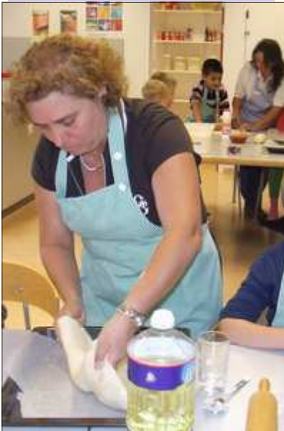
Myndirnar í Skólavefritinu í dag eru af evrópsku kennurunum sem heim-sóttu Hvaleyrarskóla í vikunni þar sem þeir voru að kenna ýmsum nemendum skólans.