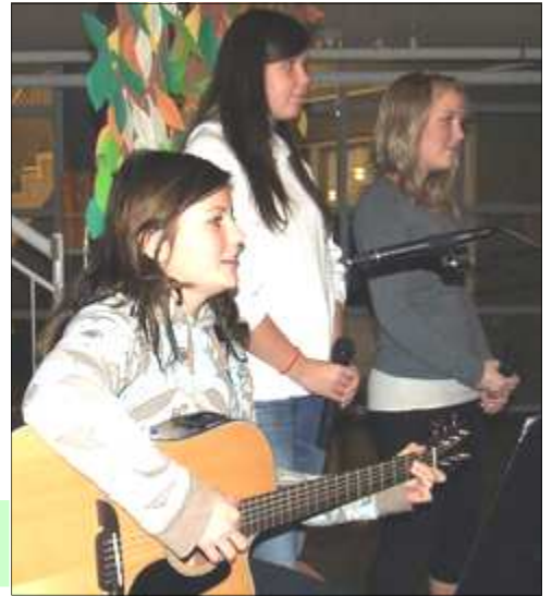
Nemendur í Setbergsskóla syngja fyrir nemendum á læsishátíð í vikunni.