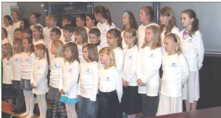
Myndir er af kór Lækjarskóla, tekin á 130 ára afmæli skólans.

Kórar frá grunnskólunum í Hafnarfirði syngja á þessum tímum: