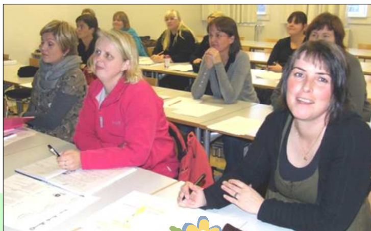
Myndin er frá námskeiði um ráð við reiði fyrir í nóvember.

Námskeið fyrir vorönn eru í undirbúningi og verða þau kynnt fyrir kennurum síðari hluta janúar. Nýju námskeiðin verða kynnt í námskeiðsbæklingi en námskeiðin verða haldin í febrúar, mars og apríl.