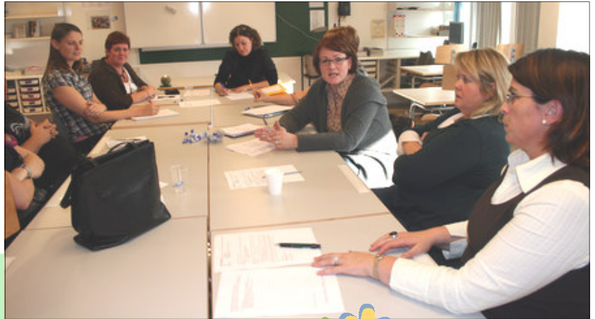
Frá fagfundi kennara: deildar-stjórnar á fundi.