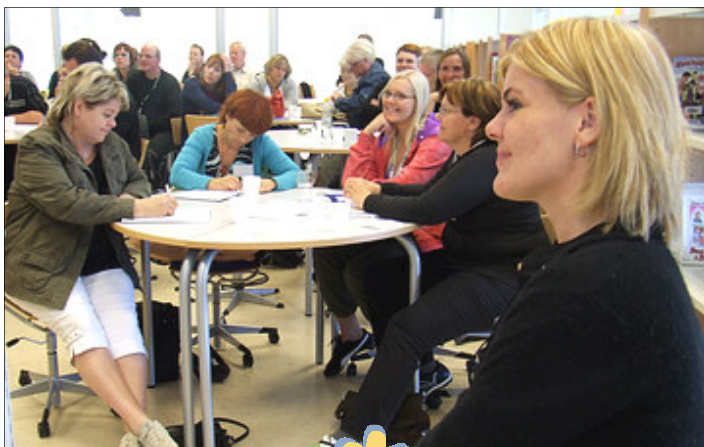
Myndin er frá námskeiði í Hraunvallaskóla.

mánudögum kl. 15-16.30/17. Það mun þó valda því að einhver námskeið skarast og kennarar verða að velja milli námskeiða. Allar tilkynningar um þátttöku eru jafnframt skráning en verði námskeið yfirfull fá kennarar tilkynningu um slíkt sérstaklega.