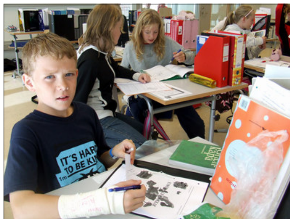
Nemendur í Hraunvallaskóla í kennslustund.

þess að allir vinni vel saman og nægar bjargir séu til staðar til að mæta margvíslegum aðstæðum barna í dag í íslensku samfélagi. Fræðsluráð hefur sent umsögn sína við frumvörpin til Alþingis.