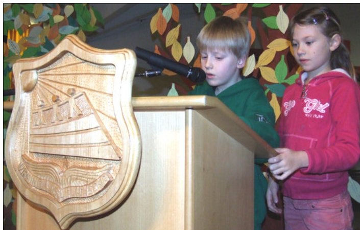
Ungir nemendur í Setbergsskóla lesa fyrir samnemendur á sal.

Það er um að gera að skila af sér í tíma því tíminn er strangur húsbóndi eins og kennarar þekkja vel úr eigin starfi.