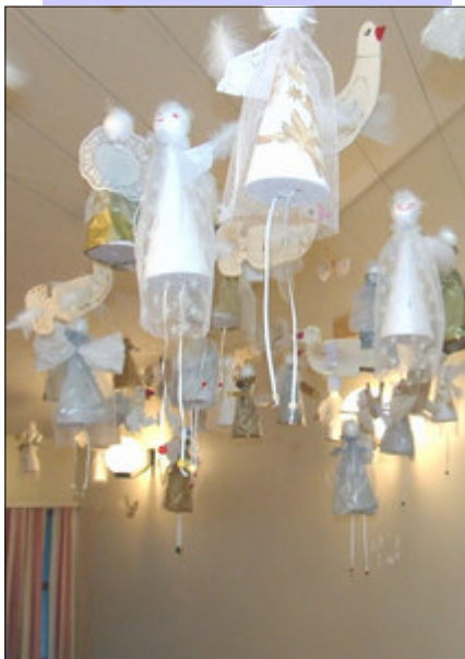
Myndirnar hér til vinstri eru frá jólapemasýningu í Hvaleyrarskóla.