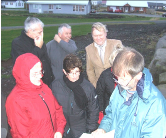
Starfsfólk Skólaskrifstofu fór í árlega haustferð fyrir stuttu og heimsótti Stóru-Vogaskóla og nágrenni skólans.

» Námsgagnastofnun var að gefa út nýtt námsefni í stærðfræði og er það nemendabók í stærðfræðiflokknum 8-10+ og nefnist bókin Stærðfræði 9+ sem tekur á ýmsum undirstöðuþáttum stærðfræðinnar. Kennsluleiðbeiningar eru væntanlegar.